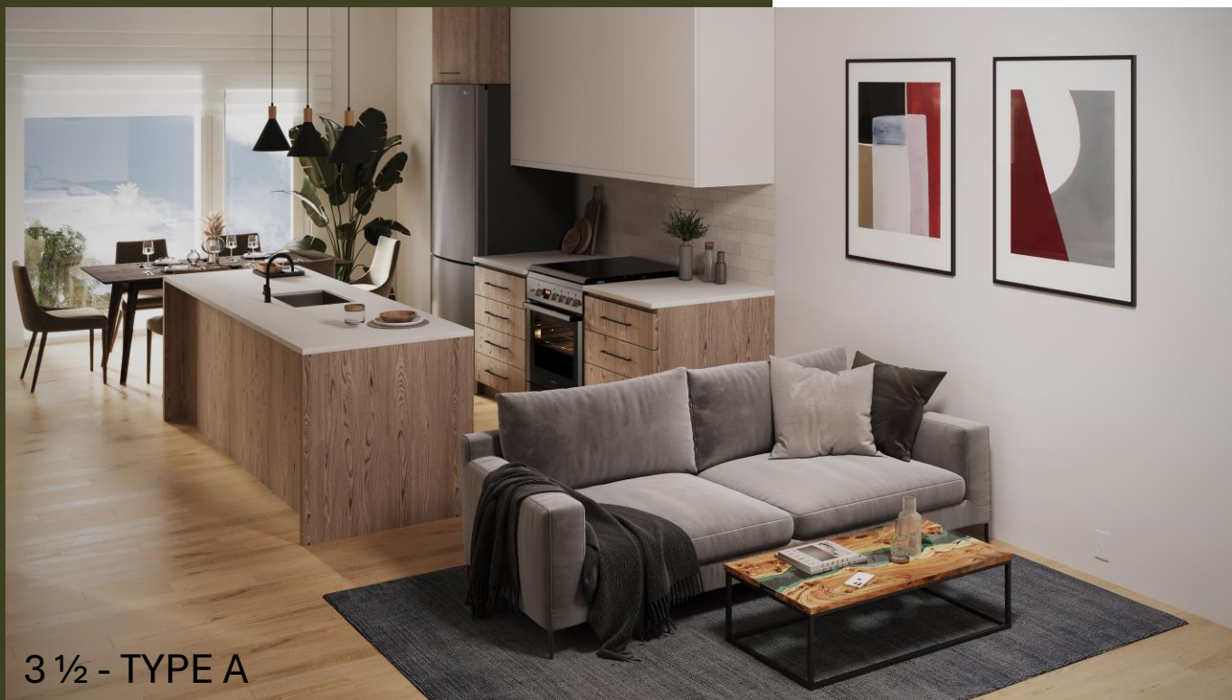
3 ½ - TYPE A

TAÏGA se situe dans un emplacement parfaitement adapté à une clientèle cherchant le confort d'une vie de quartier paisible, mais souhaitant un accès facile à la culture, à la gastronomie et aux espaces d'affaires du centre-ville de Montréal.